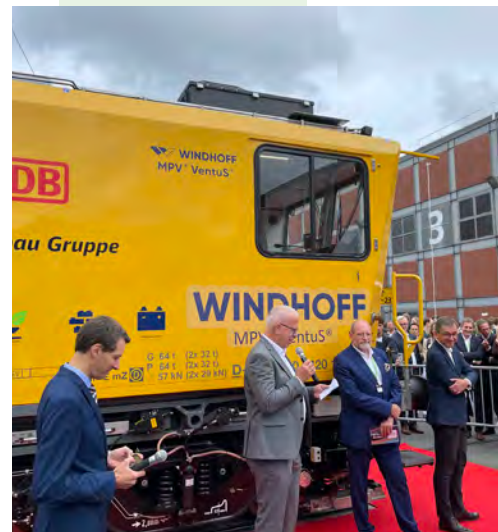
Die Taufe des MPV® VentuS® Typ DB GAF, jetzt offiziell «Main GAF» genannt, war ein voller Erfolg.