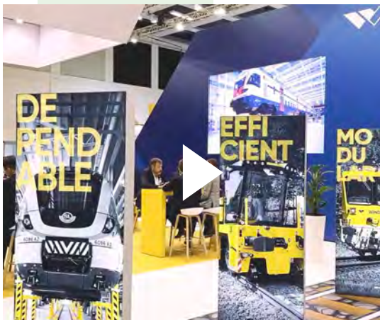
Hier gehts zum Video von Innotrans