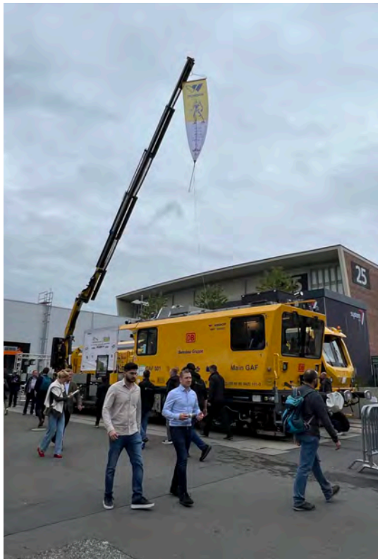
Multifunktionsfahrzeug MPV® VentuS® Typ DB GAF