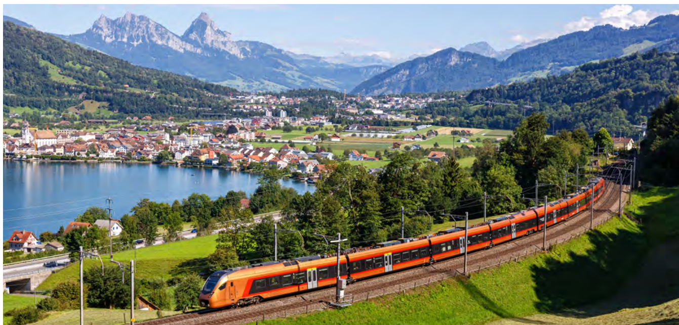
Entspannt anreisen mit der Südostbahn

Windhoff Schweiz gratuliert der SOB zu diesem Erfolg und ist stolz, mit innovativer Technik wie der neuen Unterflur-Hebebühne ein Teil dieser Erfolgsgeschichte zu sein.